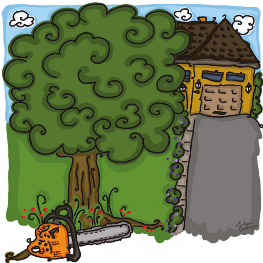
Illustration : Evelynne Bélanger