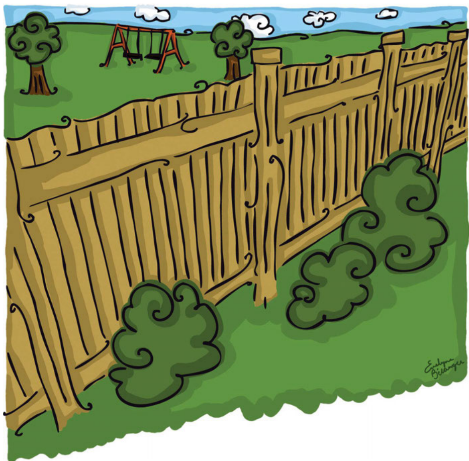
Illustration : Evelyn Bédange