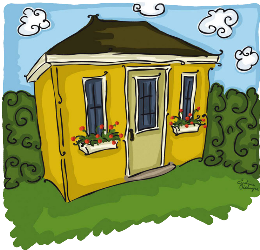
Illustration: Evelyn Bédinger