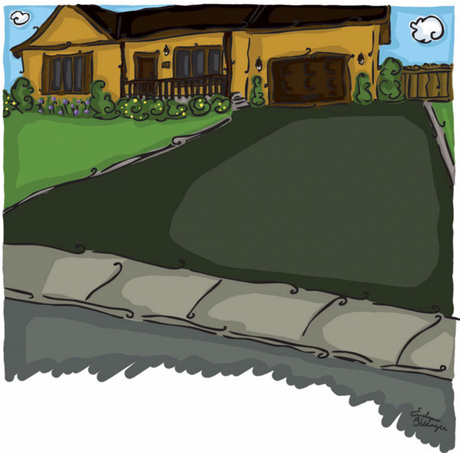
Illustration : Evelyne Bélangier