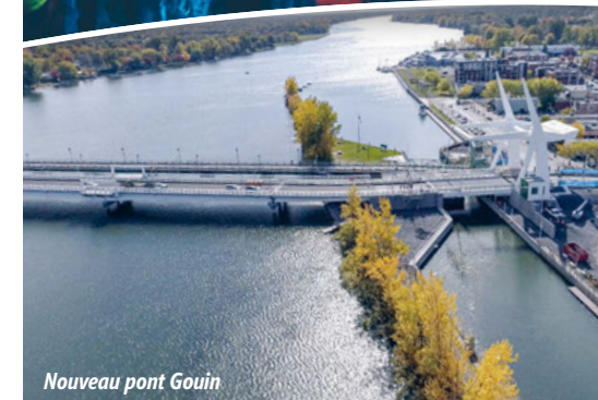
Nouveau pont Guoin