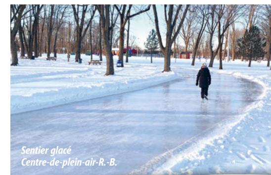
Sentier glacé Centre-de-plein-air-R.-B.

♻️ Imprimé sur papier recyclé Enviro 100