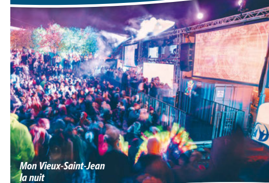
Mon Vieux-Saint-Jean la nuit