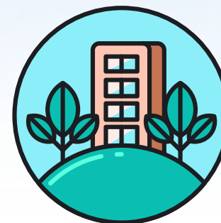
Aménagement du territoire