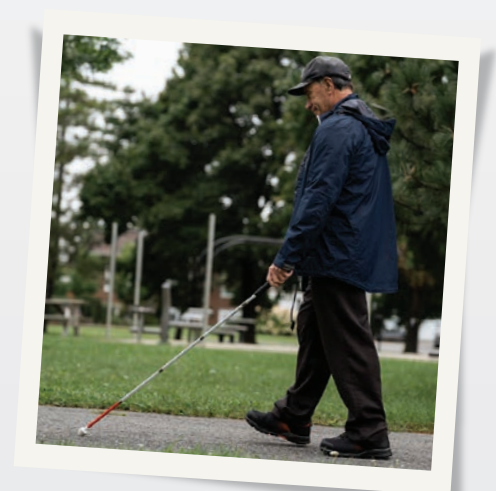
Corridor de déplacement large et libre d'obstacles