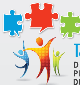
Table de concertation DES ASSOCIATIONS DE PERSONNES HANDICAPÉES DU HAUT-RICHELIEU-ROUVILLE