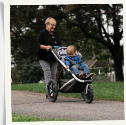
Sentier de parc uniforme, ferme et à faible pente