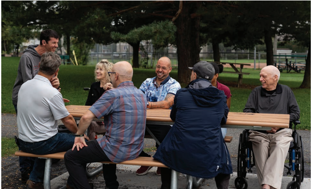
Table à pique-nique adaptée de couleur contrastante en bordure de sentier