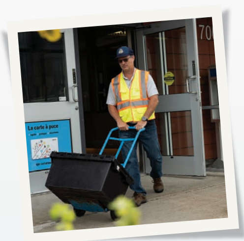
Système d'ouverture de porte automatique, entrée sans seuil et aire de manœuvre adéquate

Elle se fait accueillante et s'ouvre sur le monde. La convivialité réfère au caractère positif des relations sociales et des relations qu'entretiennent les personnes avec leur environnement naturel et bâti. La notion d'inclusivité est d'abord apparue en lien avec la lutte contre la pauvreté pour graduellement s'étendre à l'ensemble de la vie urbaine. 6