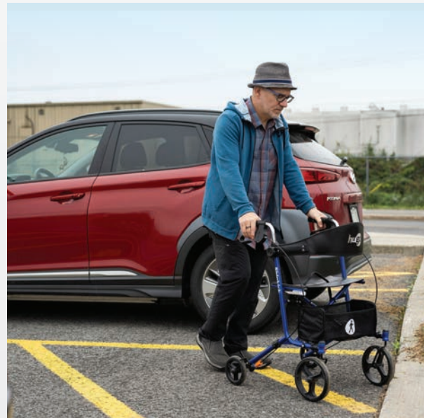
Stationnement réservé avec zone hachurée attenante à un corridor de déplacement sécuritaire et libre d'obstacles