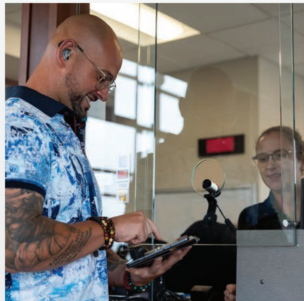
Utilisation d'une tablette pour communiquer avec les personnes sourdes ou malentendantes

L'accessibilité universelle est un objectif à atteindre et une culture organisationnelle à développer. Elle devrait être intégrée dans tous les projets dès leur idéation.