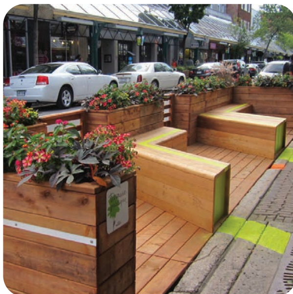
Modèle de placottoir, rue Saint-Hubert, Montréal