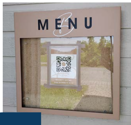
Menus en gros caractères ou accessibles en format numérique

Vous désirez poursuivre vos lectures sur le sujet et réaliser un autodiagnostic de votre commerce sur l'accessibilité universelle ? Consultez notre édition spéciale du Zone Affaires , juin 2023.