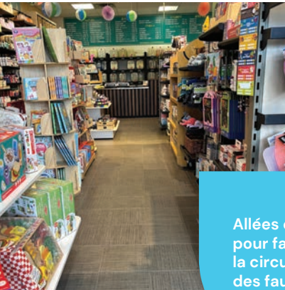
Allées élargies pour faciliter la circulation des fauteuils roulants

De nombreux commerces ont déjà intégré des aménagements favorisant l'accessibilité universelle. Ces initiatives démontrent qu'il est possible d'améliorer concrètement l'expérience client tout en répondant aux besoins d'une clientèle diversifiée.