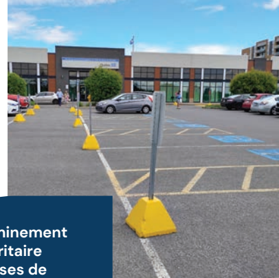
Cheminement sécuritaire et cases de stationnement réservées aux personnes à mobilité réduite

Dans un contexte commercial, l'accessibilité universelle consiste à offrir à toutes les personnes, quelles que soient leurs capacités, une expérience client inclusive, autonome et équitable. Elle implique de concevoir les environnements, les services et les communications de manière à répondre aux besoins diversifiés de la clientèle, incluant notamment ceux des personnes ayant des limitations physiques, visuelles, auditives ou cognitives.