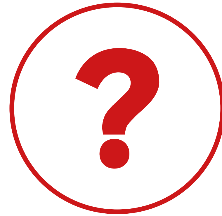
Incertitude des marchés