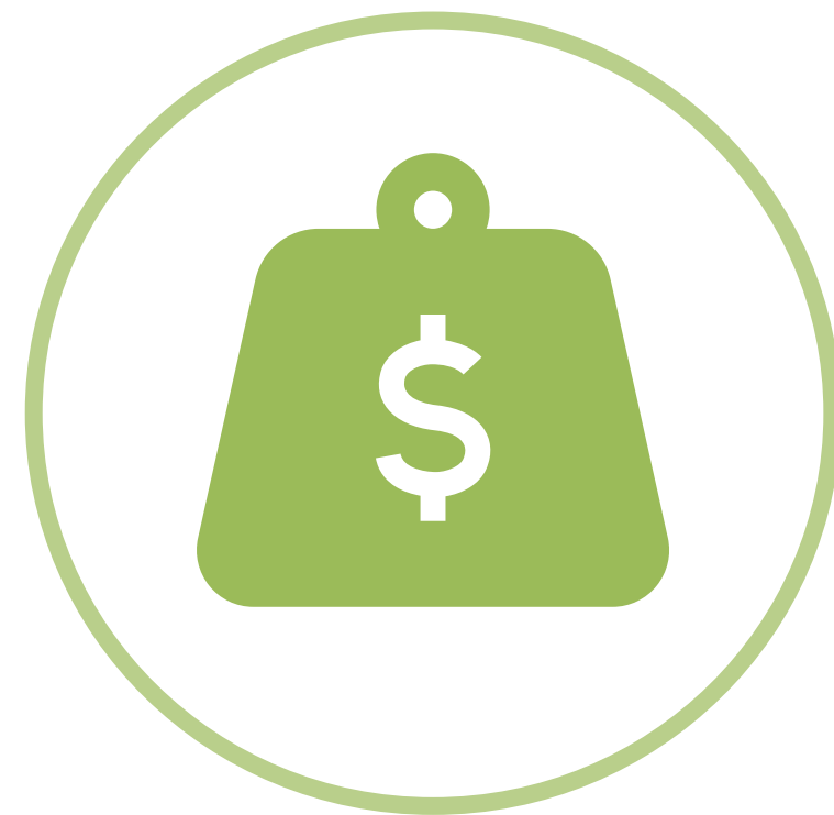
Pression du service de la dette