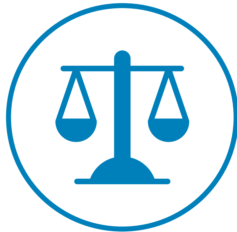
[ DÉCEMBRE 2025 ] Budget équilibré